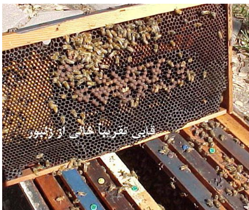
قابی تقریباً هالی از زنبور