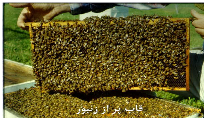
قاب پر از زنبور

در خرید کندو یکی از مهمترین پارامترها زمان خرید می باشد . بهترین زمان برای خرید زمانی است که زنبورها زمستان که فصل کاهش جمعیت ها و یا فصل سکون و عدم فعالیت تولیدی است را پشت سر گذاشته باشند و وارد فصل بهار که فصل ازدیاد جمعیت و بچه دهی و آغاز تولید محصول زنبور داری می باشد آغاز شده باشد . در ایران بهترین زمان در مناطق گرمسیری بهمن و نواحی معتدل اسفند و مناطق سرد سیر فروردین می باشد .